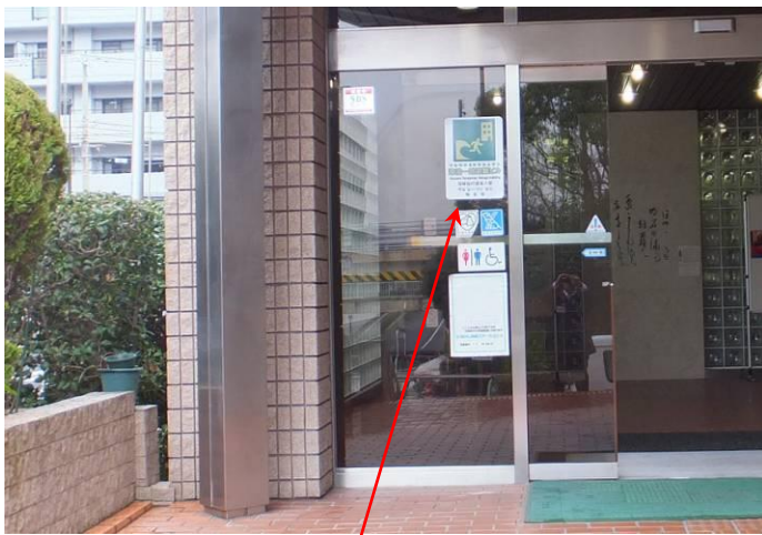
津波一時避難ビル標識