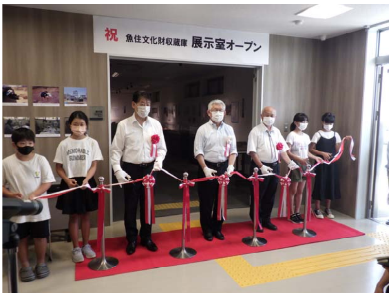
収蔵庫オープニング