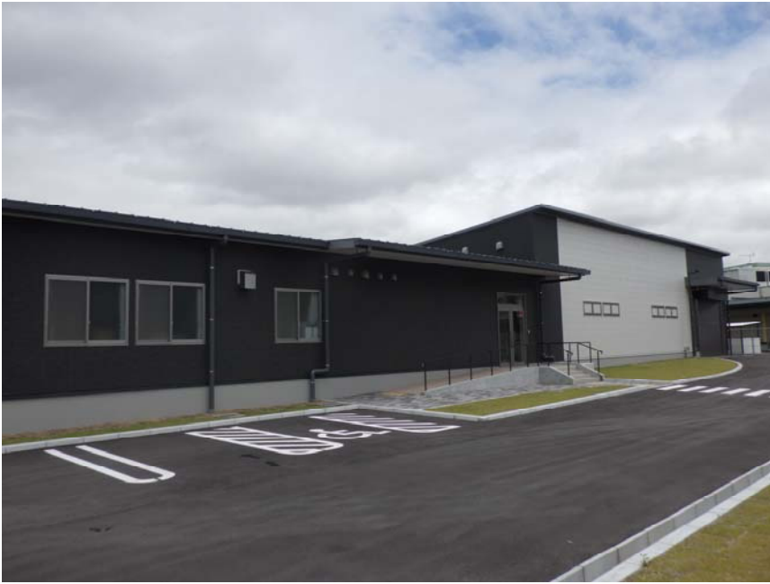
魚住文化財収蔵庫外観