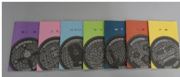
ヘリテージ明石作成の冊子

調査は明石工業高等専門学校、神戸学院大学人文学部、「ひょうごヘリテージ機構H20東播」が協力している。調査成果をまとめた小冊子は、ハンディサイズで、手に持ってまちの歴史的風景を見つけることを目的として作成されている。平成 25 年度から江井島、大蔵、魚住、二見、城下、人丸、船上・林の 7 地区を調査して、冊子を刊行しており、今後も継続して地区別調査ならびに小冊子の刊行を予定している。