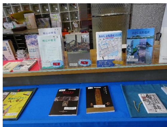
歴史文化に関する刊行物

一方、平成 27 年度から、明石民俗文化財調査団を立ち上げて、3 ヶ年の調査を実施した。平成 27 年度は「明石の農村」を発刊した。同冊子では、地域に残る独特の祭礼や年中行事、水利絵図や古文書を通じた村の成立、農業技術の在り方や農村生活実態をテーマとして、聞き取り