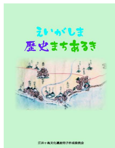
「えいがしま歴史 街まちあるき」冊子 (江井島まちづくり協議会)

江井島地域では、「江井ヶ島文化遺産冊子作成委員会」、「江井島まちづくり協議会」が中心になって、「江井島小学校校区」の史跡、寺社、公共機関、文教、人物、生活文化、産業、交通機関、病院などを対象に、地域の歴史と現在の姿を記述し、「えいがしま歴史まちあるき」冊子を平成30(2018)年3月31日に刊行している。