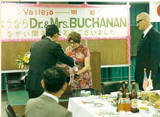
ブキャナン先生歓送会