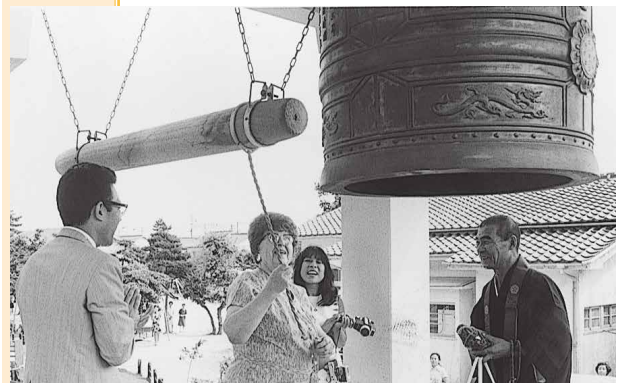
ダグラス市長市内見学のひととき