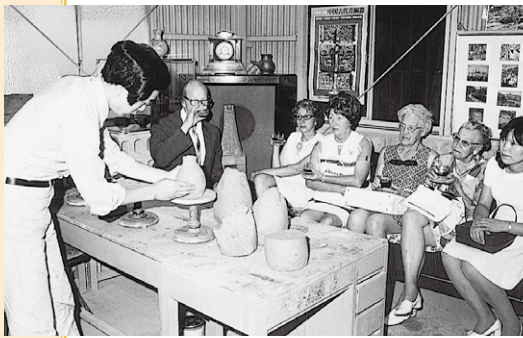
やきものを楽しむ