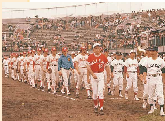
高校野球親善試合

6月20日 } 28日 ダグラス市長を団長とする高校野球チーム一行41名が来明、市内4高校と親善試合の他、各種歓迎行事を通じ、友好親善を深める。