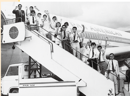
第3回学生親善派遣団