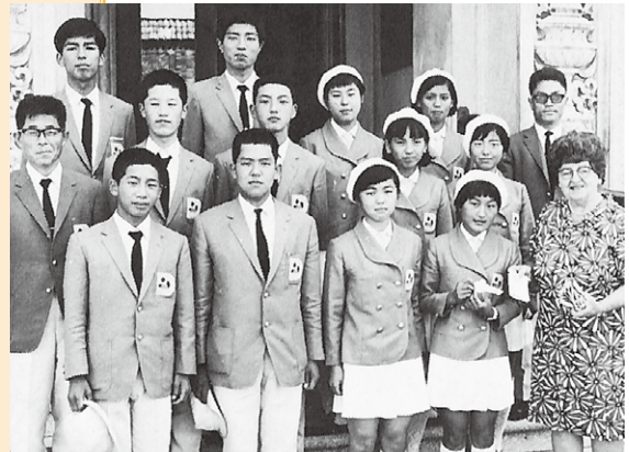
第2回学生親善派遣団