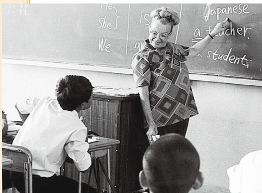
ライデン先生授業風景

9月2日 ライデン先生、市内5中学校で訪問教師として英語指導にあたる。 (75年3月20日)