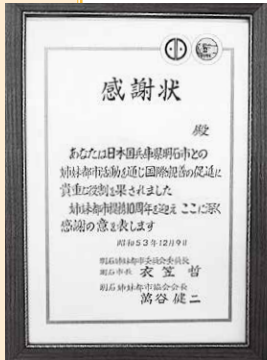
バレホ市の功労者への感謝状

また、トーマス・E. エインズワス米国大阪・神戸地区総領事夫妻をお迎えし、ティーパーティを開催、ホームステイ受け入れ家庭等の功労者、バレホ市側功労者に対して感謝状を贈呈。