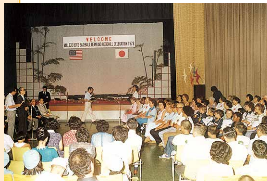
ホームステイ家庭との対面風景

ーグOBチーム、松が丘バレオーズと親善試合、記念植樹他各種歓迎行事を実施し、都市提携10年の友好親善を図る。