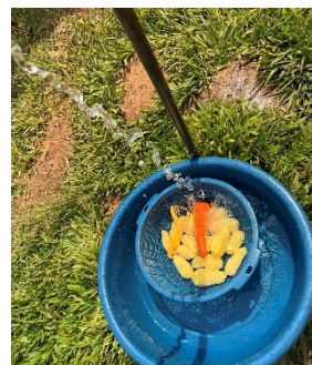
外の水道でお野菜を洗う

断水が続くと食器を洗うのも、洗濯をするのも全部外です。 シャワーやトイレ用の水くみも必須です！！