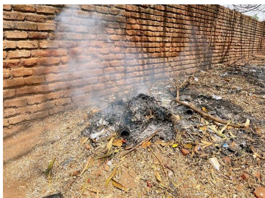
敷地内のゴミ焼却場所

ゴミはすべてセルフ焼却！やり方がわからずただゴミに火をつけていたのですが、「それでは燃やしきれないよ！」とお掃除のおばさまが教えてくれました(笑)