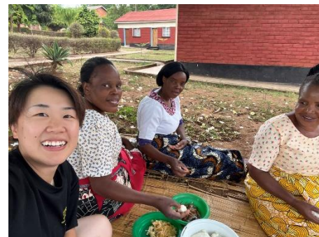
お掃除のおばさまと一緒に