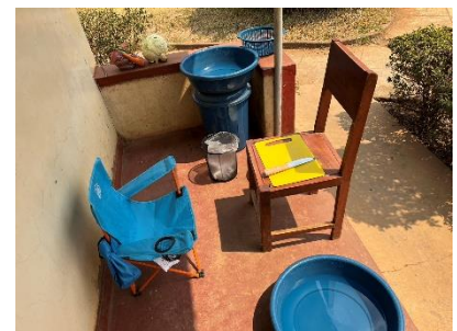
玄関先での調理風景