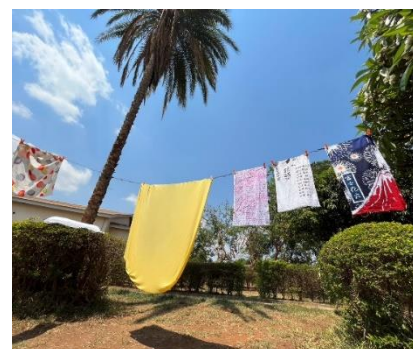
青空で干す洗濯物