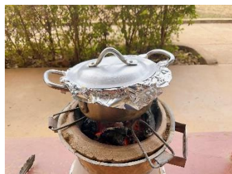
バウラーでご飯を炊く

停電で電気が使えないときは、バウラーと呼ばれる七輪を使って料理をします。火をおこすのも早くなりご飯も上手に炊けるようになりました！ ご飯のおこげが美味しいんです！！