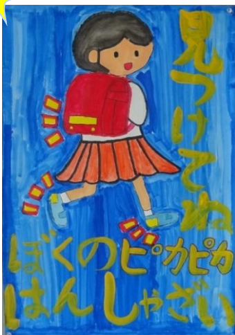
明石交通安全協会賞 (大久保小学校2年生)