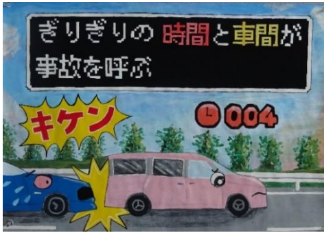
明石市長賞(望海中学校2年生)