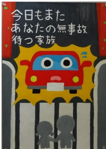
明石交通安全協会賞 (望海中学校3年生)