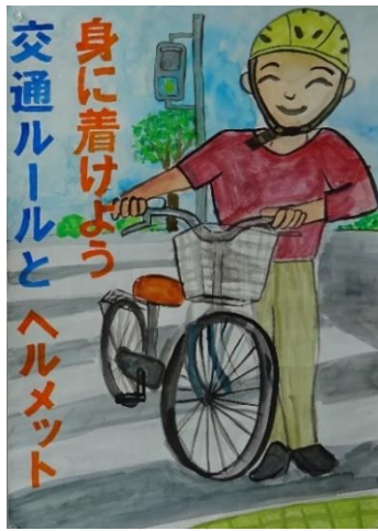
明石市教育長賞 (人丸小学校6年生)