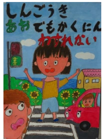
明石市議会議長賞 (二見小学校4年生)