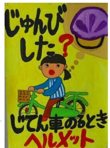
神戸新聞明石総局長賞 (錦浦小学校3年生)