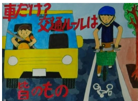
明石警察署長賞 (魚住小学校5年生)