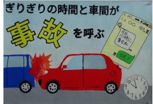
明石警察署長賞(望海中学校1年生)