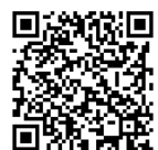
読話手話入門申込フォーム

私は、(難聴者(未手帳・聴覚 _____ 級) / 難聴者の家族 / 健聴者) です。 その他、配慮が必要なことがあれば、早めにご連絡ください。