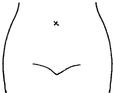
(ストマ及びびらんの部位等を図示)