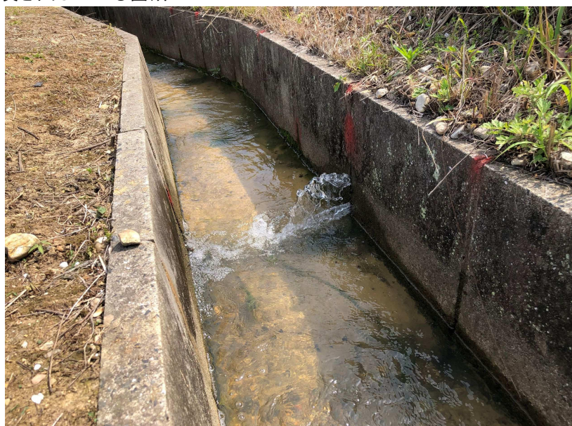
水位が高いと噴き出している箇所