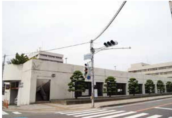
安全な歩行には信号機の設置が有効

29年に策定した明石市交通安全計画で掲げている歩行者優先の考え方を浸透させる取り組みを進める必要がある。横断歩道を安全に歩行するには信号機の設置が有効だが、全ての横断歩道に早急に設置することは難しいため、運転者は歩行者がいるときは一時停止を行い、歩行者は手を上げるなどの意思表示 示してから横断するよう意識啓発を図り、警察には取り締まりの一層の強化を依頼していく。また、本市が毎年行う各小学校区の通学路の点検も、運転ミス等により車両が歩道に乗り上げる可能性があることを念頭に置いて実施し、対策を検討していく。