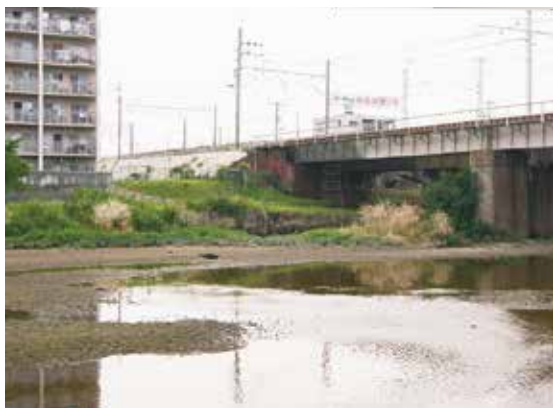
水害の危険性がある明石川

河川事業に位置付け、今年度4億4千万円の予算を県に割り当てたところだ。 改修工事は、河川内で行われるが、列車運行の安全確保が必要となるため、工期はおおむね7年かかると見られており、総事業費は約40億円となっている。なお、この工事は国・県が行うため、市に費用負担は発生し