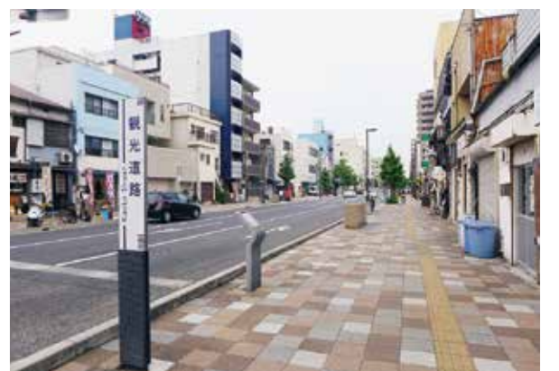
あったらいいな 一息つけるベンチ

化を図るとともに駅前広場や周辺道路に高齢者や足の不自由な人が休憩できるベンチの整備等を行った。 また、本市は、共生社会ホストタウンに指定され、高齢者をはじめ誰もが安心して快適に暮らすことができるまちづくりを目指している。さらには、ユニバーサルデザインのみならず、福祉等の関係団体、交通事業者、障害当事者等による協議会を設置し、協議や調整を図りながら実行計画の策定に向けて検討を進めている。