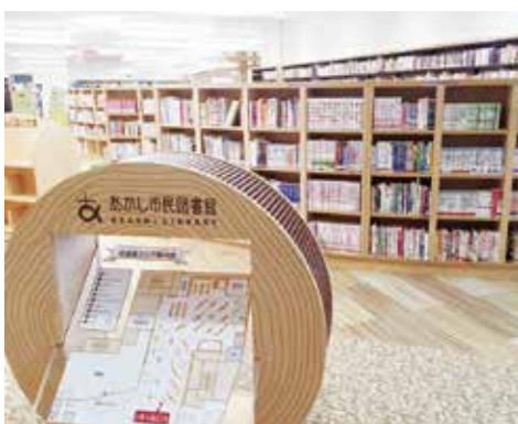
あかし市民図書館

今後、一層の環境整備に向けて、西明石や大久保を含め各地区における新たな図書館の整備について、基本構想の策定に向けた取り組みを進めていく。