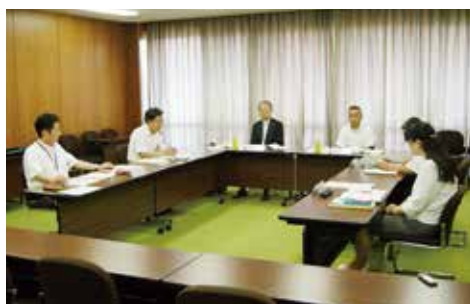
7月10日開催のハラスメント防止委員会

を設置します。本委員会は、外部有識者2名、市幹部職員3名、職員労働組合の代表1名で構成し、特別職によるハラスメントについても相談対象とします。