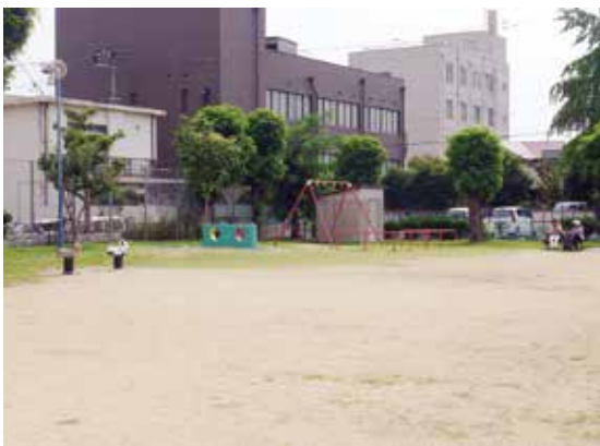
みんなが憩える公園へ

守るため、公園内は、屋外も含めて全て禁煙となる。本市も県の条例改正を踏まえ、管理する全ての公園を禁煙にするともに、一定の面積を上回る公園では、立地や利用状況を考慮し、屋外での喫煙場所の設置を検討するなど、誰もが安心して快適に過ごせる公園づくりに努めていく。