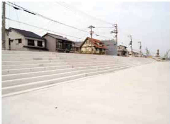
岬町付近の防潮堤

近年、災害は激甚化しており、計画規模を上回る災害を想定し、より一層の防災・減災対策に取り組むことが重要である。災害時の備えとしては、「自助」「共助」を踏まえ、市民に速やかに避難する意識付けを促す必要もあることから、昨年5月に隣接する川端公園で市民参加型の水防訓練を実施した。今年も国と連携して、実際の防潮