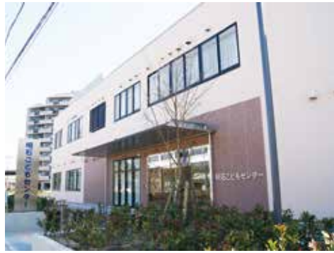
明石こどもセンター(大久保町ゆりのき通)

答 本市は高齢者、障害者、子どもの相談等に対して包括的な支援を行う、地域総合支援センターを設置すると