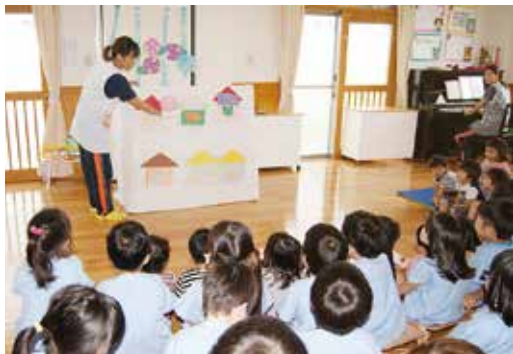
安心して働ける環境を

答 本市の待機児童は、昨年度に約2千人の受入枠を拡充したことにより8年ぶりに減少したが、4月現在では412人であり、さらなる