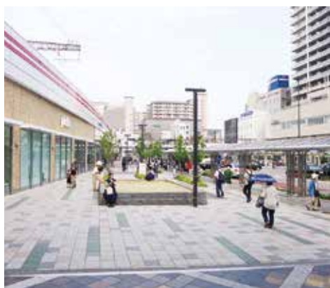
整備予定地(ピオレ明石西館南側)

所よりも広く、車いすでも利用しやすい高さのカウンターを備えるほか、ユニバーサル観光についての情報を提供し、多言語による案内など、誰もが利用しやすい案内所としたい。公共トイレは、ユニバーサルデザインに配慮し、音声での誘導案内装置の設置に加え、性別を気にせず利用できる多機能トイレの配置を予定している。