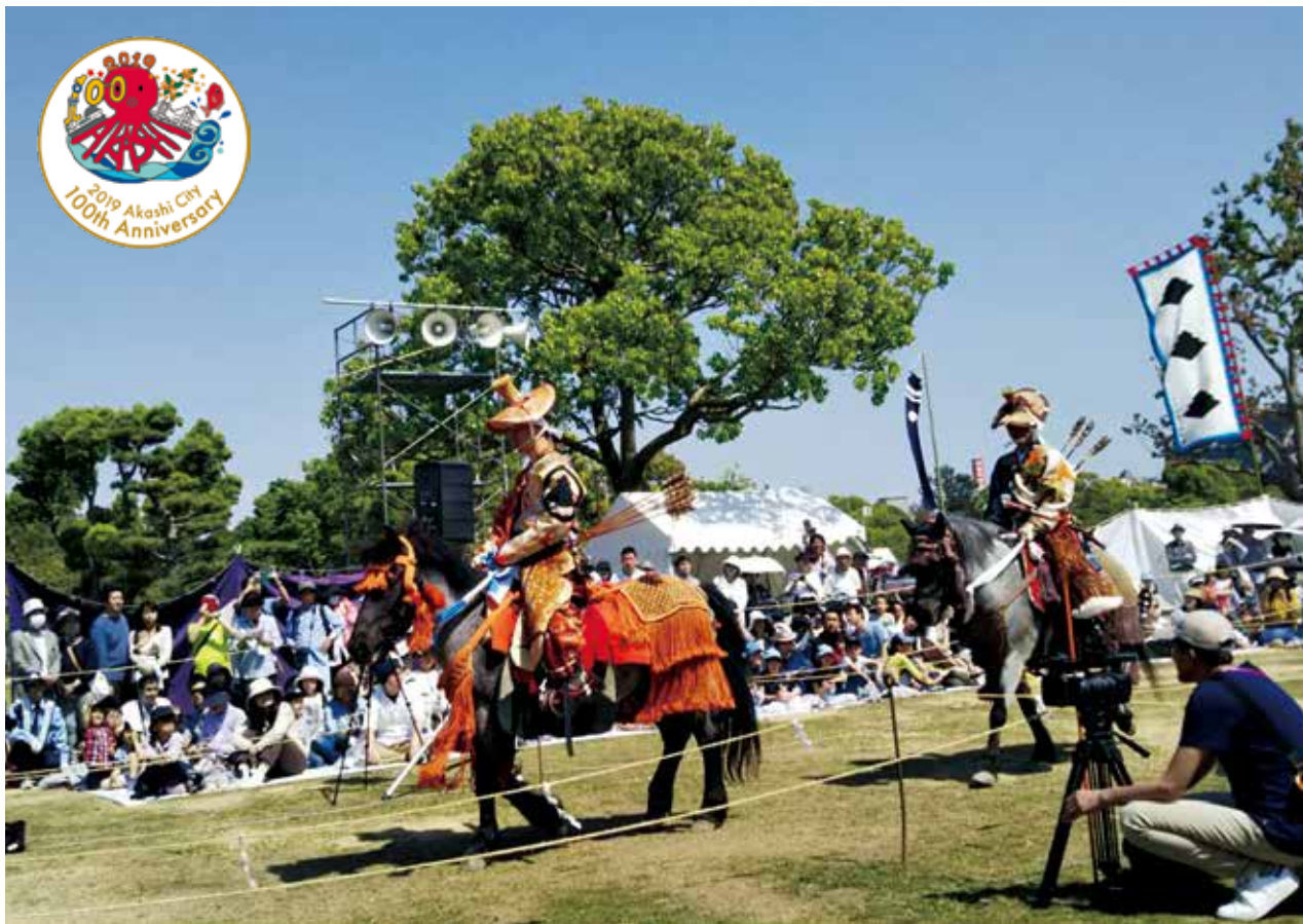
小倉小笠原流による流鏝馬神事(令和元年5月11日 明石公園)

今年2月に市立13中学校の各学年から1クラスを抽出して実施し、1294名から回答がありました。給食について、74.8%が「好き」「どちらかといえば好き」とおおむね好意的な評価を得る一方で、23.6%が「どちらかといえば好きでない」「好きでない」と回答しています。生徒からは、「味のおいしさ」にさらなる期待が寄せられています。市は、味の濃淡は学校給食摂取基準もあるが、素材の味を感じられるよう、塩分等を抑えた薄味でもおいしい給食を目指し、生徒の要望を可能な限り満たせるよう研