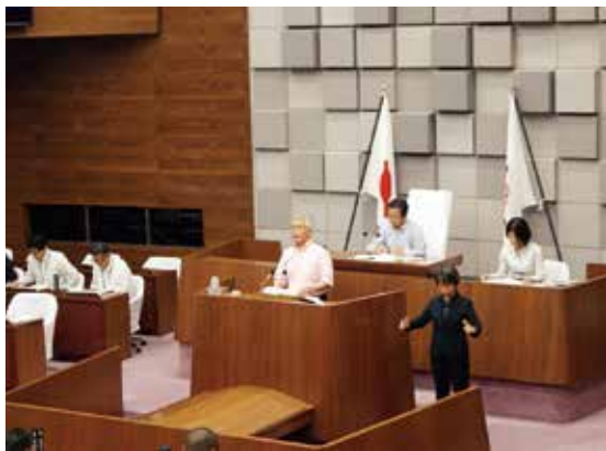
意気込みを語る市長

答 本市では、人口が6年連続、出生数は4年連続で増加している。出生率は国、県の平均を大きく上回り1・64となっており、2025年には国が目標とする1・8を達成したい。また、明石駅前を訪れる人は、再開発前に比べ7割増え、目標値の2倍の新店舗が出店した