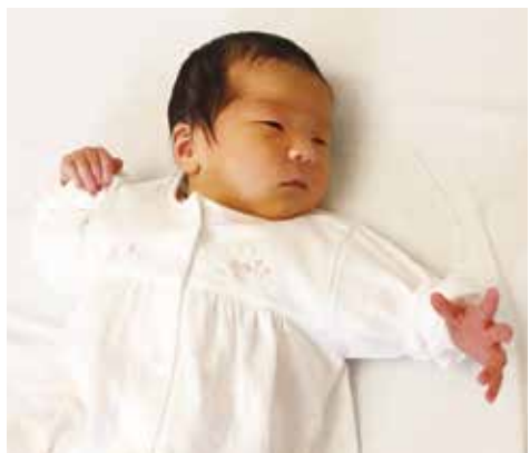
子どものために早期の聴覚検査を

相談してもらうとともに、家族の疲弊や問題の複雑化を防ぐため、ひきこもりに特化した相談を行う「ひきこもり専門相談窓口」の設置を検討している。ひきこもりは、10代から中高年に至るまで、年齢層が幅広く、抱える問題もさまざまである。今後の支援策につながるため、保健所を中心に実態把握に努め、関係機関との連携強化を図っていきたい。