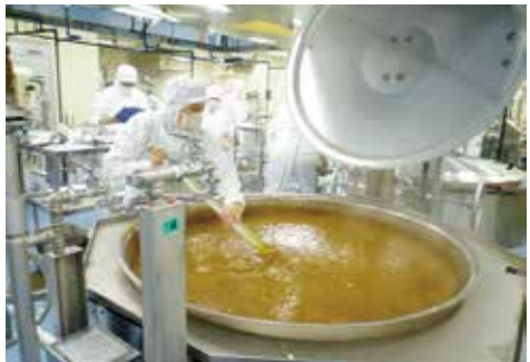
栄養バランスのとれた給食を提供

今年2月に市立13中学校の各学年から1クラスを抽出して実施し、1294名から回答がありました。給食について、74.8%が「好き」「どちらかといえば好き」とおおむね好意的な評価を得る一方で、23.6%が「どちらかといえば好きでない」「好きでない」と回答しています。生徒からは、「味のおいしさ」にさらなる期待が寄せられています。市は、味の濃淡は学校給食摂取基準もあるが、素材の味を感じられるよう、塩分等を抑えた薄味でもおいしい給食を目指し、生徒の要望を可能な限り満たせるよう研