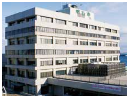
老朽化が進む現庁舎

大久保の3駅を中心とした徒歩圏内エリアを候補地とし、市有地を中心に必要面積が確保できる土地を検討してきた。その後、防災面のリスクや財政負担などを考慮し、有識者会議での意見も踏まえ、