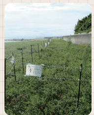
藤江海岸のハマビシ保全エリア