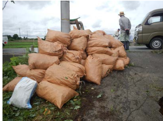
R2.9.17 瀬戸川防除作業 兵庫・水辺ネットワーク、明石市