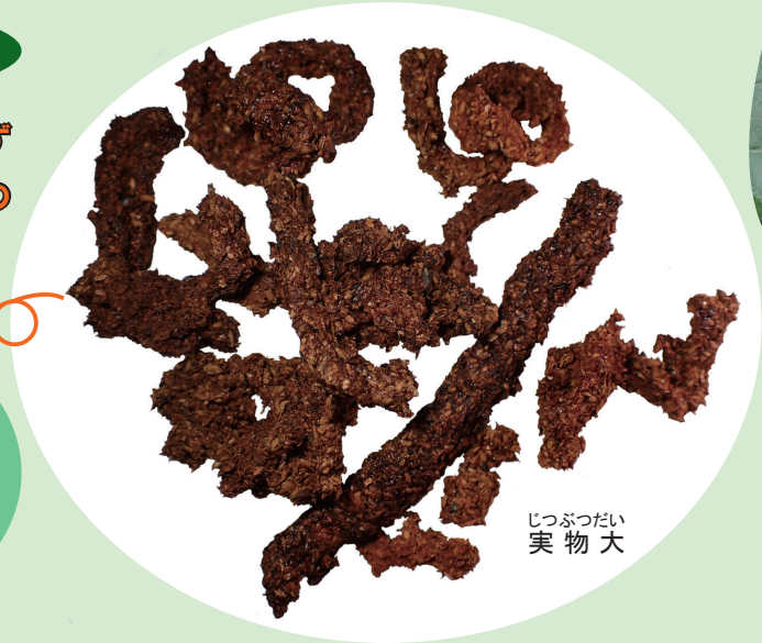
じつぶつだい 実物大

幼虫は「フラス」という木くずと幼虫のうんちが混ざったものを、木の外にたくさん出します。