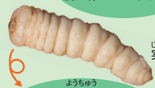
じつぶつだい 実物大