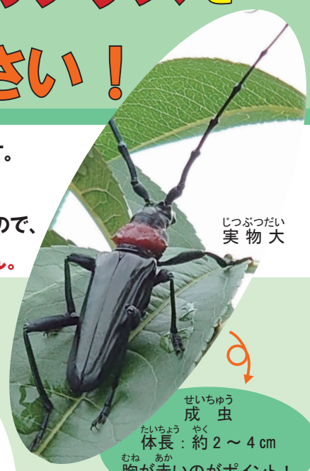
じつぶつだい 実物大

早く虫を見つけて木を守ったり、この虫が他の場所へ広がらないようにしないとけません。