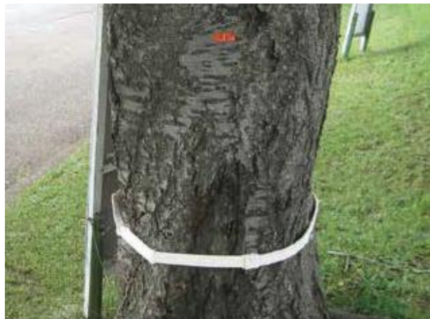
(写真38) 樹幹に巻き付けたバイオリサ・カミキリ スリム

手袋を着用して袋から糸状菌を含む不織布を取り出し、1本ずつ切り離して広げます。施用する樹木の幹を1周できる長さに不織布をホチキスで繫げます。繫げた不織布を地際から40cm前後の高さで樹幹に巻き付け、ホチキスで不織布の両端を留めて固定します(写真38)。不織布上の粉は殺虫性のカビの孢子であり、これがカミキリに付着して接触感染により殺虫します。