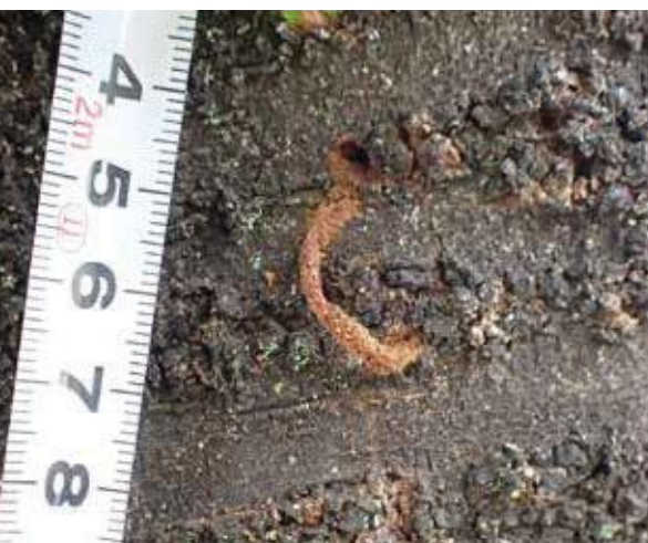
(写真5) サクラから出てきた細いフラス

クビアカツヤカミキリの幼虫が木の中にいるのを探す手掛かりはフラスです。フラスとは、幼虫が木の内部から押し出す排出物で、木くずと虫糞の混ざったものです(写真4)。幼虫はある程度成長すると排糞孔と呼ばれる穴を樹皮にあけて、木の中の邪魔なフラスを外に出します。クビアカツヤカミキリは5～9月に盛んにフラスを排出するので、そのフラスを目印にすることで、被害を早くに発見できます。クビアカツヤカミキリのフラスは幼虫が小さい時は、小さな排糞孔を穿ち、太さ2mmほどの細く連なったフラスを出します(写真5)。幼虫が大きくなると最終的には太さ8mmほどまで太くなり(写真6)、十分に発育した後に木部(内部の材の所)へと掘り進むときは木くずを多く含むフラスを大量に出します(写真7)。