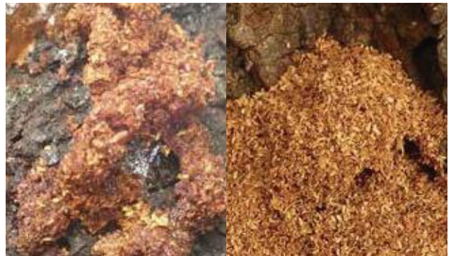
(写真13) クビアカツヤカミキリのフラス