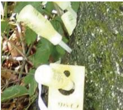
(写真33) 注入容器での注入