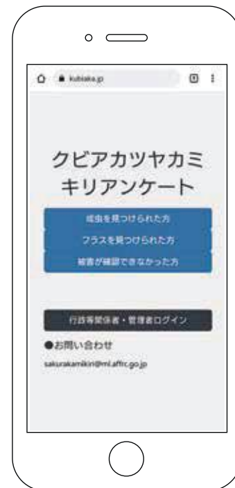
(写真41) クビアカツヤカミキリアンケート