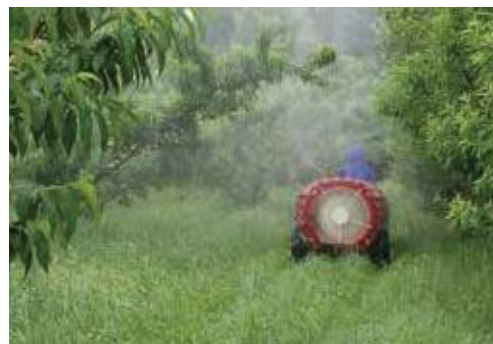
(写真40) スピードスプレーヤーによる農薬散布

本種の被害が発生してしまったモモやウメの果樹園地では、薬剤散布による成虫駆除を徹底する必要があります。成虫対象の散布は基本的には被害木1本ずつ噴霧器で処理しますが、甚大な被害が発生した園地ではスピードスプレーヤー(写真40)や大容量の薬槽用タンクを付置したエンジン式動力噴霧器の導入により広範囲かつ迅速に処理することも検討してください。