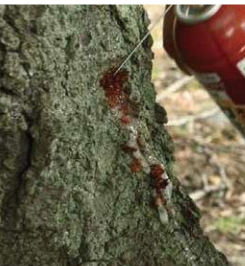
(写真29) 溢れ出るまで注入した農薬