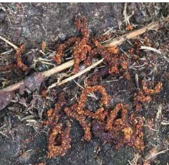
(写真6) サクラから出てきた太いフラス

近隣でクビアカツヤカミキリの被害が発生したら、このようなフラスの発生がないかを地域の目で注視することが被害を封じ込める鍵になります。