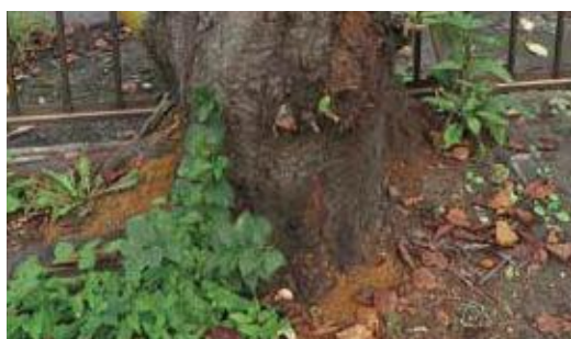
(写真26) 蛹室が作られる時のフラス