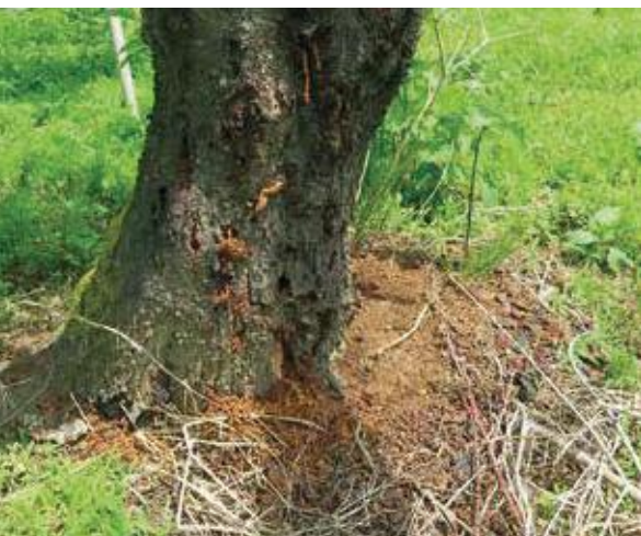
(写真4) モモの木の地際に溜まったフラス

クビアカツヤカミキリの幼虫が木の中にいるのを探す手掛かりはフラスです。フラスとは、幼虫が木の内部から押し出す排出物で、木くずと虫糞の混ざったものです(写真4)。幼虫はある程度成長すると排糞孔と呼ばれる穴を樹皮にあけて、木の中の邪魔なフラスを外に出します。クビアカツヤカミキリは5～9月に盛んにフラスを排出するので、そのフラスを目印にすることで、被害を早くに発見できます。クビアカツヤカミキリのフラスは幼虫が小さい時は、小さな排糞孔を穿ち、太さ2mmほどの細く連なったフラスを出します(写真5)。幼虫が大きくなると最終的には太さ8mmほどまで太くなり(写真6)、十分に発育した後に木部(内部の材の所)へと掘り進むときは木くずを多く含むフラスを大量に出します(写真7)。