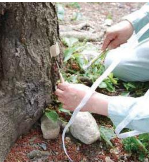
(写真28) フラスの除去