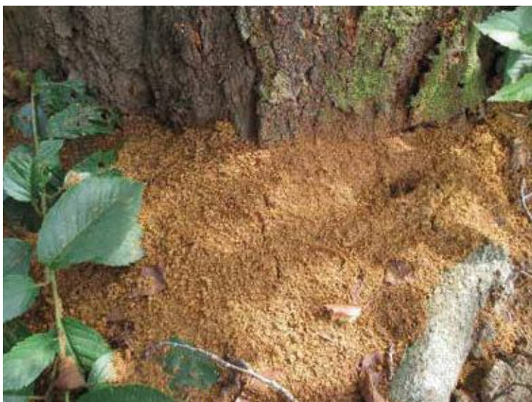
(写真7) 木くずを多く含む大量のフラス