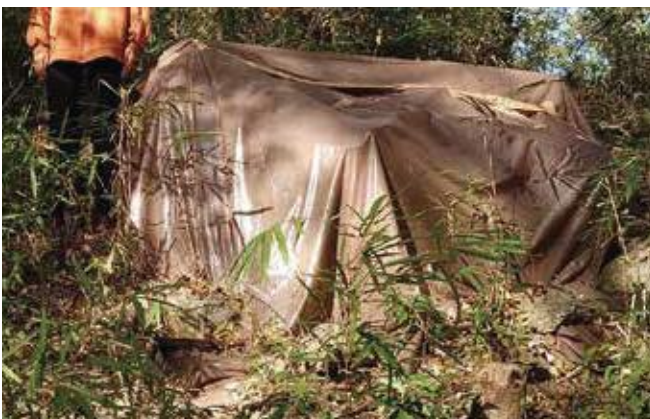
(写真35) 燻蒸用シートを敷設した様子 丸太の集積はこの写真よりも高くしない

保護具を装着して、土で覆っていないシートの端から丸太の表面にまんべんなく所定量の燻蒸剤を散布し、速やかにシートのすべての端を土で覆います。14日間燻蒸することで、被害材の内部の幼虫を駆除できます。