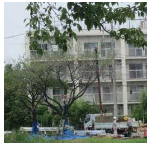
(写真22) 伐倒駆除現場 上方からクレーンで吊りながらの作業