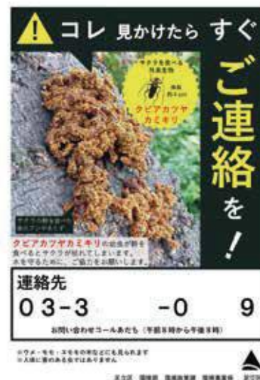
(図3) 自治体ポスター事例