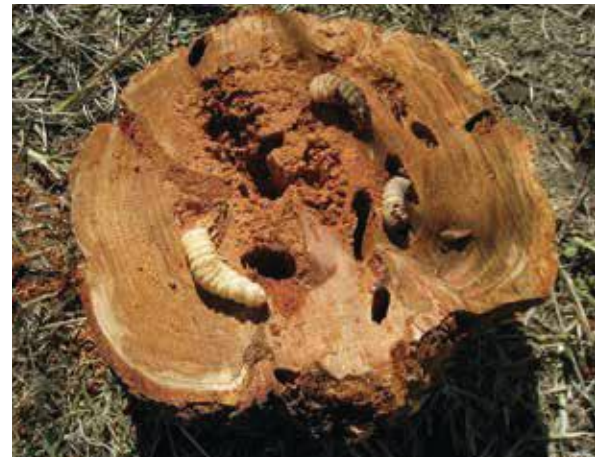
(写真3) 枯死したモモの中に潜んでいた幼虫

1本の木を多くの幼虫が加害すると、その後、1年から数年で枯死してしまふことがあります(写真2、3)。