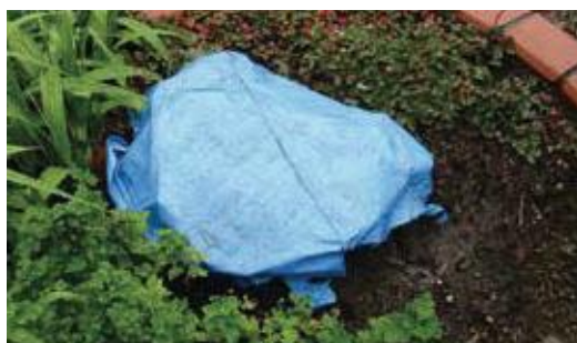
(写真24) ブルーシートで被覆した切り株