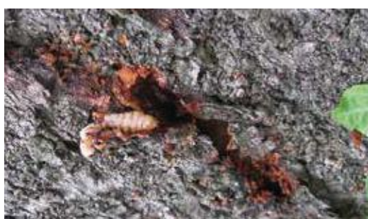
(写真25) 新鮮なフラスと掘り取られた幼虫