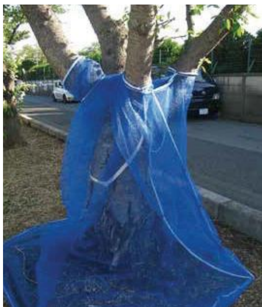
(写真27) 網巻きをしたサクラ