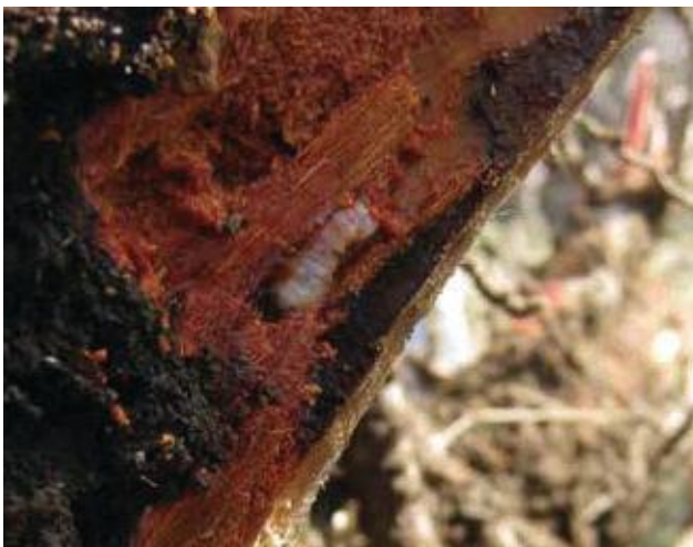
(写真11) 樹皮下の幼虫