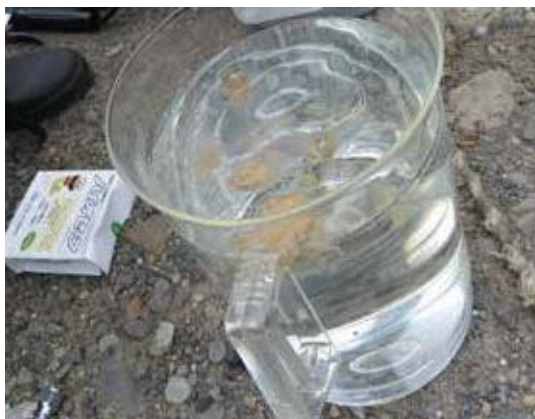
(写真37) 線虫剤の希釈

クーラーボックスで冷やしながらか移動させた本剤を取り出し、注ぎ口のあるバケツなどの中で1トレイ(2,500万頭入)を2.5Lの水で希釈します(写真37)。希釈した懸濁液をよくかき混ぜた後に噴霧器に移します。