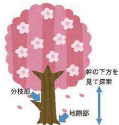
(図2) 木の中で最初にフラスの 出やすい箇所と探索の目線

実際に現場で被害を探す方にクビアカツヤカミキリのフラスの実物を配ると、探す目を肥やすことができます。早期に被害を発見ができれば、そこから間を置かずに対策をとることが重要です。被害が発生していない時から、侵入を発見したらどうするのかを樹木管理者が把握しておくことが求められます。