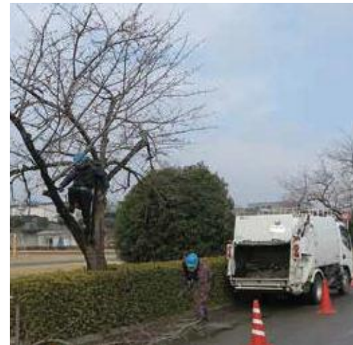
(写真21) 伐倒作業と被害木をのせて焼却場に運ぶためのパッカー車

伐倒して木全体を処理することはコストがかかるので、木を加害している幼虫が少ないときは、フラスの排糞孔から坑道をたどって幼虫を個別に掘り取る駆除も行われています。掘り取りは、排糞孔から千枚通しや目打ちで坑道をたどりながら外樹皮を剥ぎ、幼虫を見つけたら刺殺します。外樹皮を剥いだところには、腐朽防止と癒合促進のために樹木用切口癒合剤(トップジンMペーストなど)を塗布します。ただし、健全部まで広範囲を掘り取ると木へのダメージが大きいため、10cm程度掘っても幼虫が見つからなかったり、新鮮なフラスのある方向が分からなかったりする場合は、他の駆除方法を考えます。また、排出されているフラスの状態、幼虫が近くにいる掘り取れそうか、奥の方にいる取ることができなそうかを判別できます。水分を多く含みいかにも新鮮なねっとりとしたフラスが出ている場合、幼虫が排糞孔の近くにいることが多く(写真25)、排糞孔から色の濃い水分の多めのフラスがある方へと坑道をたどって幼虫を探ります。乾燥しているパラパラとしたフラスが大量に出ている場合、すでに幼虫が蛹室を木部に形成して奥深くにいるため掘り取りは困難です(写真26)。