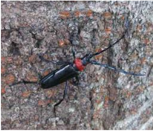
(写真8) クビアカツヤカミキリ雌成虫