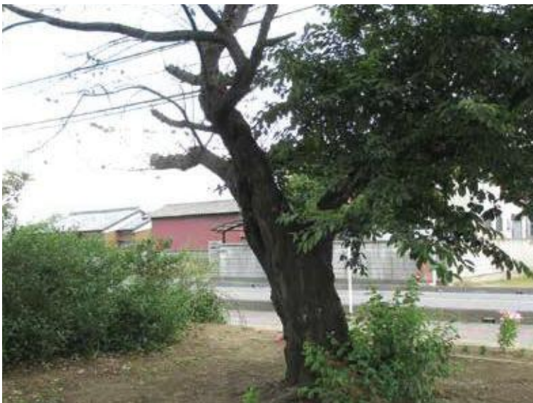
(写真1) 左側の枝が枯れてしまったサクラ