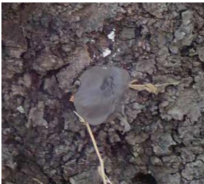
(写真34) 切口被覆塗布剤での処理