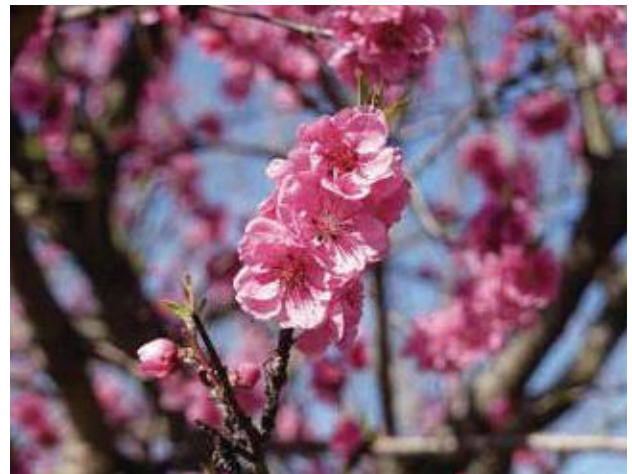
(写真18) ハナモモの花