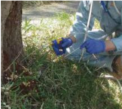
(写真32) 薬剤注入器での注入