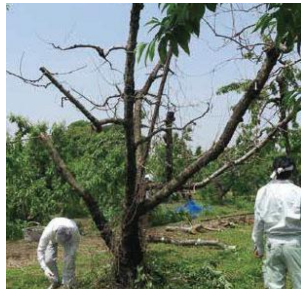
(写真2) 枯死したモモ