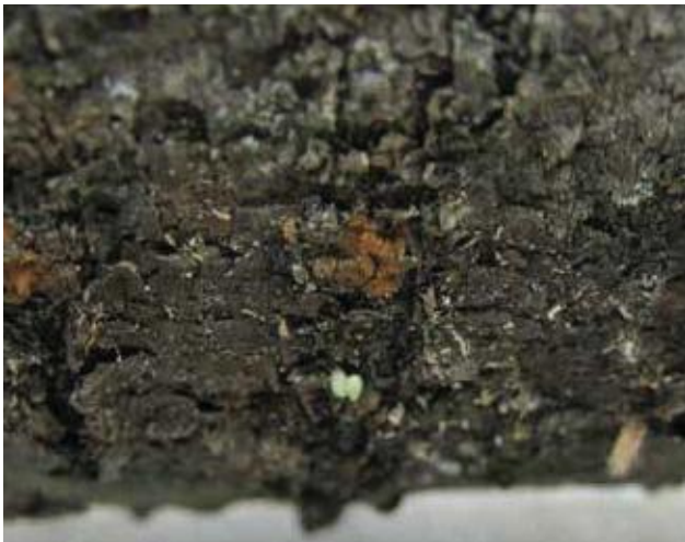
(写真10) クビアカツヤカミキリの卵