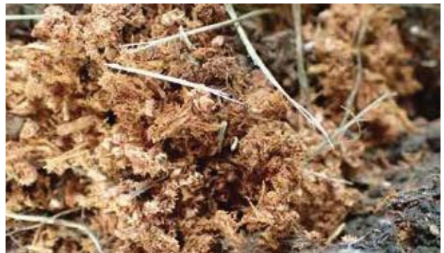
(写真15) ゴマダラカミキリのフラス