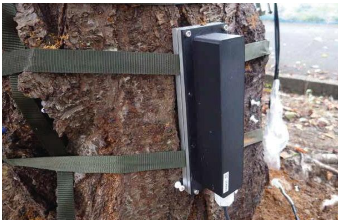
(写真39) 振動発生装置を木に取り付けたところ

成虫が木に飛来しても幹の上での活動を抑制し長居させることを防ぐことで、木に産卵させない技術の開発も進められています。この技術は、振動発生装置を木に取り付け、クビアカツヤカミキリをびっくりさせる振動を、一定間隔で幹に伝えるというものです(写真39)。現在、効果の検証が行われていて、産卵などの行動を抑制させられる可能性が示されています。