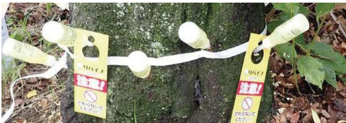
（写真31）樹幹注入の穴のあけ方 一定間隔にあけるところを決め、その上下にばらつかせてあける

なお、加害がひどい木では、内部に腐朽が進んだ場所が存在することがあります。腐朽がない健康な場所ではドリルであけた穴から固い白く健康な木くずがでてきますが、腐朽した場所では柔らかく茶色い木くずが出てきます。もし腐朽した部分があれば、そこにあけた穴は使わず、その上方の腐朽がないところに別の穴をあけます。枯死部を避けて施用しないと、上部に薬が届かなくなってしまいます。