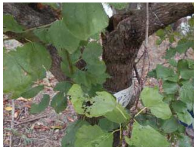
(写真20) アンズ被害木