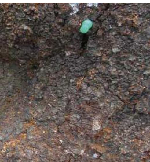
(写真30) だるまピンでマークしたところ