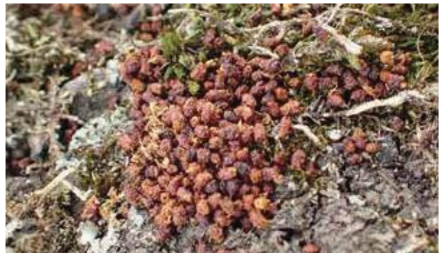
(写真14) コスカシバのフラス