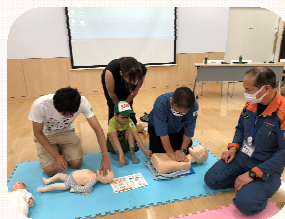
▲(過去の講座の様子)