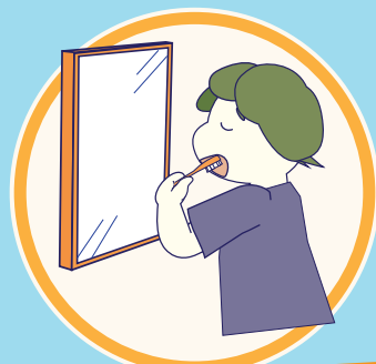
使用済みハブブラシを洗う