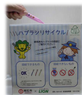
回収ボックスイメージ