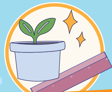
新しいプラスチック製品に 生まれ変わる