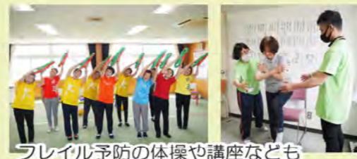
フレイル予防の体操や講座なども各地で開催中

認知症になっても、安心して暮らし続けることができるよう認知症の人と家族を支援する取り組みを進めています。