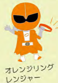
オレンジリングレンジャー