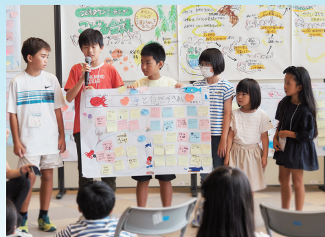
明石の未来を話し合う小・中学生 (8/18「こども会議」)

申し込み 10月30日(月)までに、①～③のいずれかの 方法で、市民とつながる課(下記)へ