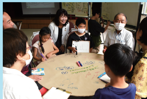
テーブルを囲んで和やかな雰囲気 (9/23 テーマ「環境～ごみ減量～」)