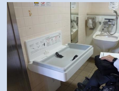
オムツ交換台(子供用)