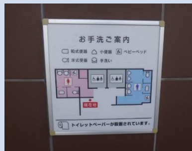
点字つき案内看板