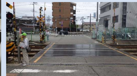
藤江駅西側の踏切