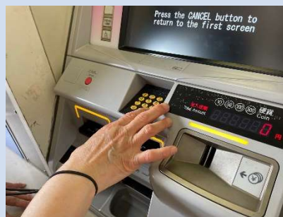
券売機のテンキー