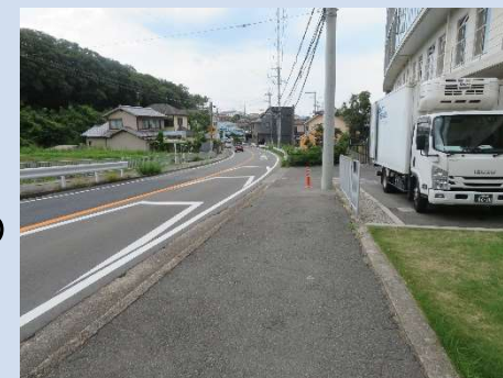
こころのホスピタルから青龍神社部分の南側