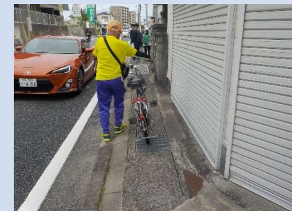
県道:歩道の幅員が狭い