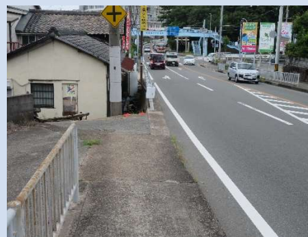
青龍神社から藤江小学校部分の南側