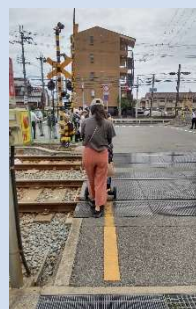
ベビーカー通行時