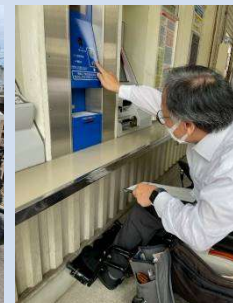
インターホン& クリアランス