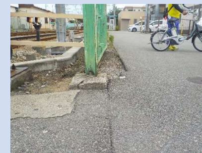
踏切南側のポールの台座