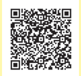
産後ケア事業利用申請書 (市ホームページ)