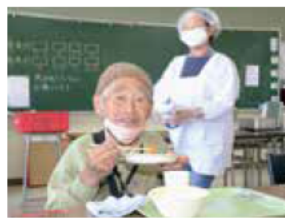
食を通じた見守り

ひとり暮らしの高齢者へ給食を提供する「みんなの給食」をお手伝いしていただける、地域団体やグループを募集します。