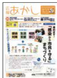
広報あかし 9月1日号

第68回兵庫県広報コンクールで、新型コロナウイルスについて特集した広報あかし1316号(令和2年9月1日発行)が、はじめて最も上位の「特選」に選ばれました。