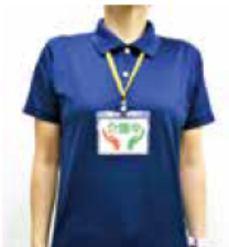
首からかけてご利用ください