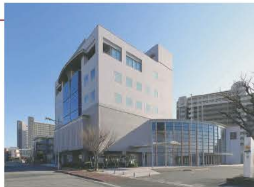
市が運営する保健所で迅速に対応しています

2018年4月に中核市に移行し、市独自であかし保健所を設置。相談の受け付けから検査や入院調整、健康観察や生活支援など感染症対策の業務を包括的にを行っています。