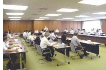
明石市ウィズコロナ官民連携会議の開催