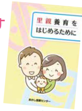
里親のことが丸わかり！ 里親さんの声もたくさん 紹介しています！

市内で活動する里親さんたちの子育て経験から学んだ工夫や知恵、ヒントなどを掲載したガイドブック「里親養育をはじめるために」を作成しました。これから里親を考えている人、里親制度や子育て支援に関心がある人には、無料で差上げます。市がすすめる2、3日程度子どもを預かる「ショートステイ里親」のQ&Aも掲載しています。ぜひ、あかし里親センターまでお問い合わせください。