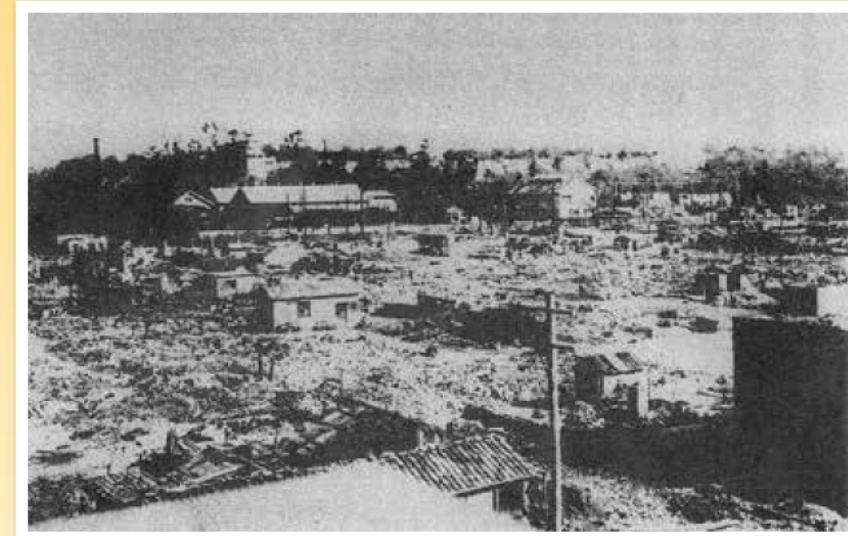
爆撃により明石城周辺は焼け野原に(昭和20年)

1944年、実家の高松市から学徒動員され、飛行機工場働いた。オレンジ色のベニヤ板で特攻機を造っていた。機械に挟まれ大けがを負った右手には、今も後遺症があります。