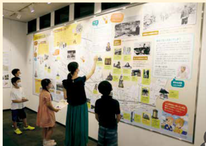
空襲の跡をたどる 写真と市地図(つり×5.5m)

明石の戦災をテーマとした市内初の常設展。イラストや写真を使って、分かりやすく解説しています。