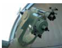
16階天体観測室の反射望遠鏡

日時／10月3日(日)午後6時30分～8時30分ごろ(受け付け午後6時～) 定員／10人 料金／1人500円(駐車料金別途200円) 申し込み／9月19日午後5時まで同館ホームページで受け付け。応募多数時抽選 ※ホームページから申し込みできない場合は電話でお問い合わせを