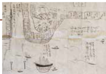
(異国船入り船につき安治川兩岸の天保山伝法村新田の諸大名御固めの図(当館所蔵横河家文書))

申し込み／往復はがき往信面に、①イベント名、②参加者全員(5人まで)の氏名、③代表者の郵便番号・住所・電話番号・参加人数を記入し、返信面に申込者の住所、氏名を記入しそれぞれの締め切り日(必着)までに同館へ。応募多数時抽選 ※1通につき1つのイベントのみ有効