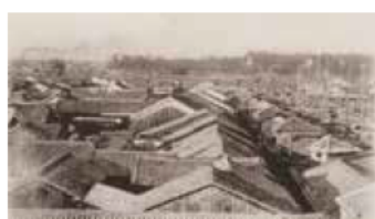
明石市制記念絵葉書より明石市全景(部分、同館所蔵)

期間/9月11日(土)～10月17日(日) 午前9時30分から午後6時30分(入館は午後6時まで) ※月曜日休館 観覧料/大人200円、大高生150円、障害者手帳などの提示で半額