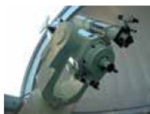
16階天体観望室の反射望遠鏡

日時/①11月6日(土) ②11月26日(金)いずれも午後7時～8時15分ごろ(受け付け 午後6時30分～) 定員/20人 料金/1人300円(駐車料金別途200円) 申し込み/