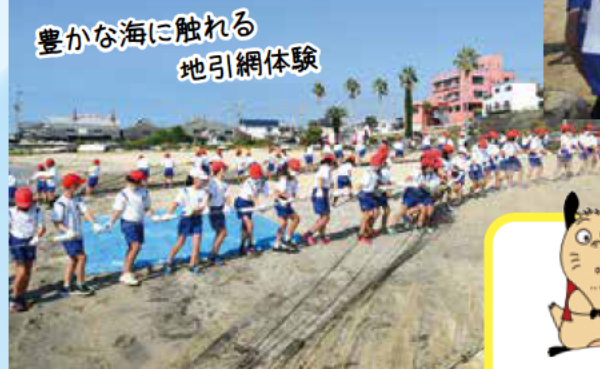
豊かな海に触れる 地引網体験