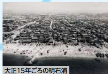
大正15年ごろの明石浦