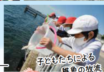
子どもたちによる 稚魚の放流