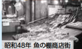
昭和48年 魚の棚商店街