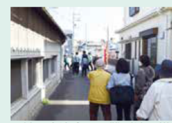
今崎野自治会の避難訓練の様子

校区住民へのアンケートの結果、多くの住民が防災に課題を感じていたため、校区独自の防災マップの作成に取り組んでいます。