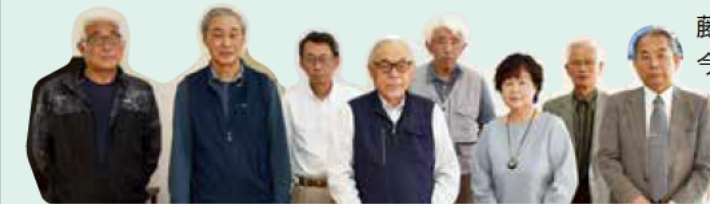
藤江校区まちづくり協議会と今崎野自治会の皆さん

ほかにも、校区内のモデル地区で、車いすの避難訓練や高齢者への見守り訪問などの共助の取り組みを進めています。