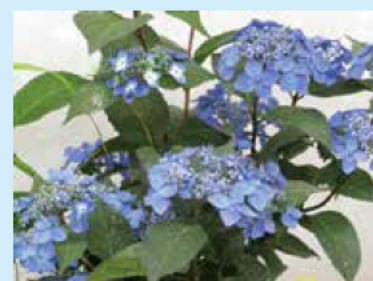
庭を明るく彩ります

江戸時代以降多彩な花色や、てまり咲き、八重咲など多くの園芸品種がつくられてきました。主な花色は青、紫、赤、ピンク、白です。比較的成長が緩やかなので、庭に植えても場所をとらず、鉢植えや山野草との寄せ植えなどでも楽しむことができます。また半日陰の環境を好むので、やや日陰の庭でも育てることができます。