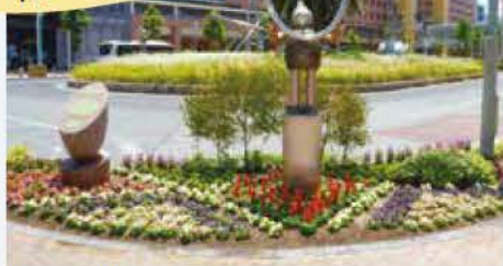
JR大久保駅前南花壇A