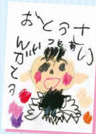
はむちゃんさん (4歳)