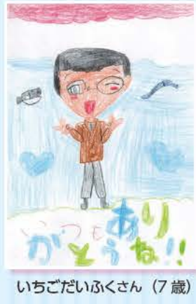
いちごだいふくさん(7歳)