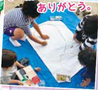
父さん子4兄弟 (10歳・8歳・6歳・4歳)