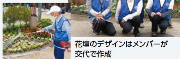
花壇のデザインはメンバーが交代で作成