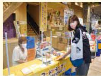
家庭から食品を持ち寄ります

お米、缶詰、レトルト食品など未開封で1か月以上賞味期限が残っている常温保存可能な食品