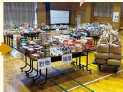
2021年1月の第6回譲渡会に集まった食品