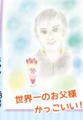
世界一のお父様 かっこいい!!!