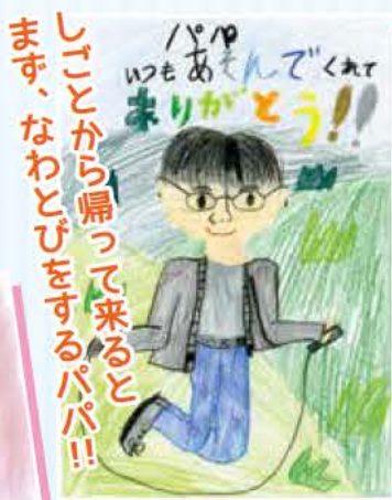
成岡 紗彩さん (8歳)

[消防局] TEL921-0119 FAX927-0119 [夜間休日応急診療所] TEL937-8499 [あかしユニバーサル歯科診療所(休日)] TEL918-5664