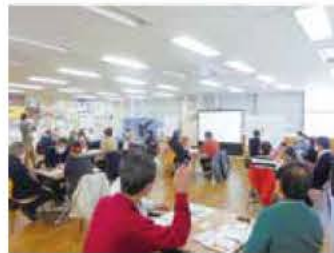
市民ワークショップを4回開催 明石の環境について話し合いました