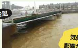
気候変動の影響が明石にも