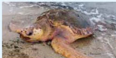
レッドリストガイドブックに掲載されているアカウミガメ

ウミガメの上陸・産卵のために、市が設置している海岸施設の外灯を消灯します。 場所/林崎・松江・藤江・江井島 期間/8月末まで