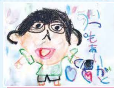
みーちゃんさん (6歳)