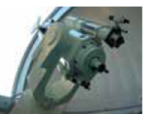
16階観測室の40cm反射望遠鏡

日時／1月21日(土)午後7時～8時15分(受け付け午後6時30分～) 定員／30人 料金／1人300円(駐車料金別途200円) 申し込み／1月7日午後5時まで同館ホームページで受け付け。応募多数時抽選