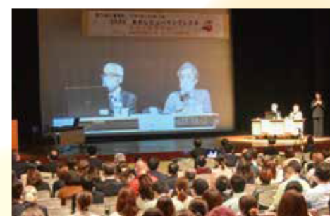
12月2日、あかしヒューマンフェスタでは犯罪被害者の遺族による講演が行われた