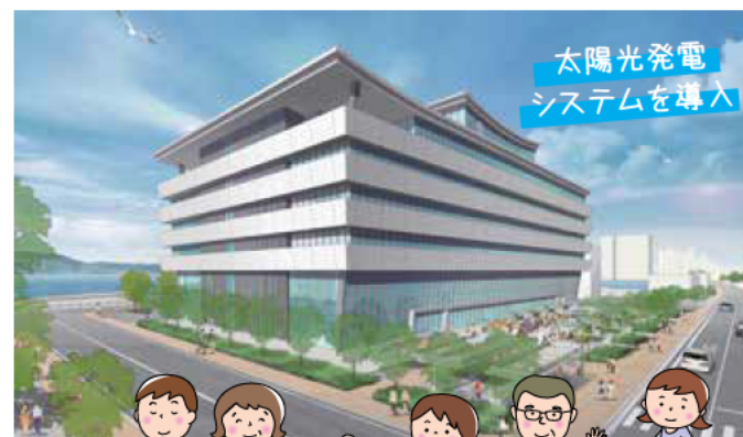
太陽光発電 システムを導入