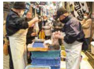
イカナゴを求める 買い物客で賑わう魚の棚商店街

購入した人は 「知人に送るた め、頑張ってく ぎ煮を炊きます」 と笑顔で話して くれました。