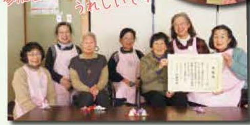
昨年、厚生労働大臣表彰を受けました