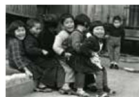
おしくらまんじゅう 昭和28年 土門拳

観覧料/大人800円、大高生600円(中学生以下無料)、障害者手帳などの提示で半額