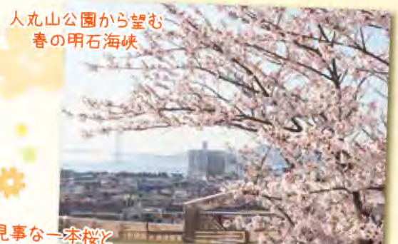
人丸山公園から望む 春の明石海峡