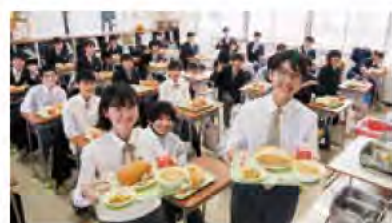
全13校で中学校給食が始まる