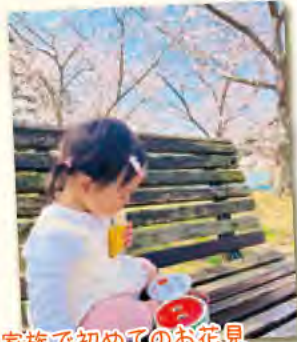
家族で初めてのお花見 ...だけと花よりバナナと絵本!