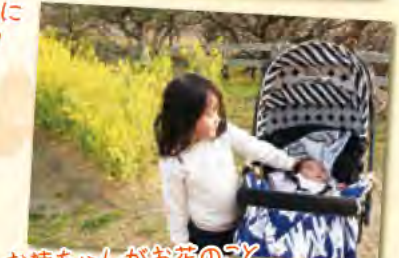
お姉ちゃんがお花のごと 教えてあげるね