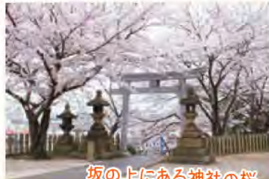
坂の上にある神社の桜 毎年綺麗に咲いています