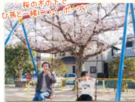
桜の木の下で ひ孫と一緒にハイポーズ!