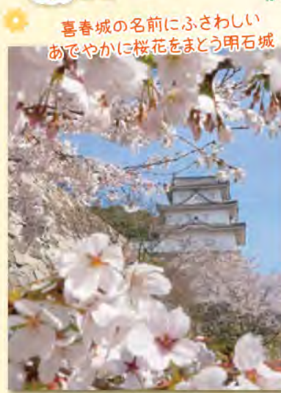
喜春城の名前にふさわしい あでやかに桜花をまとう明石城

広報あかし3月15日号で募集した「市内で撮影した春を感じる写真」にたくさんのご応募ありがとうございます。みなさんからいただいた春の写真の一部と、見ごろを迎えた市内の桜を紹介します。お問い合わせ/広報課 (TEL)918-5001 (FAX)918-5101