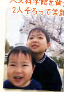
見事な一本桜と 天文科学館を背景に 2人そろって笑顔!