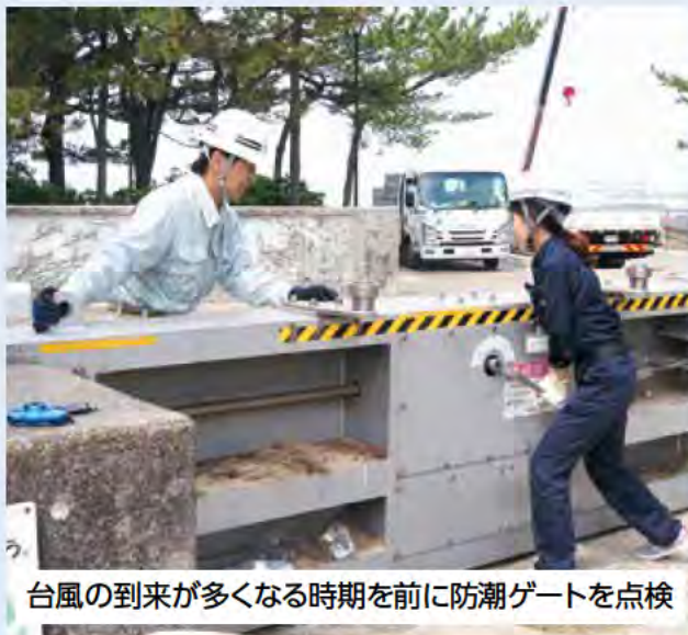
台風の到来が多くなる時期を前に防潮ゲートを点検