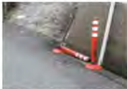
ポストコーンの破損