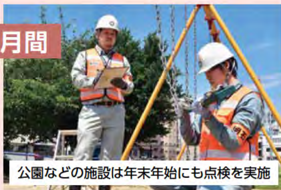
公園などの施設は年末年始にも点検を実施

市が管理するすべての施設を一斉に点検します。不備があった場合は補修などを行い、安心して利用できるように対策をします。