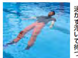
泳がず浮いて待つ

無理に泳ぐと体力を消耗します。沈まないように仰向けになって浮いて救助を待ちます。