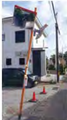
カーブミラーの傾き