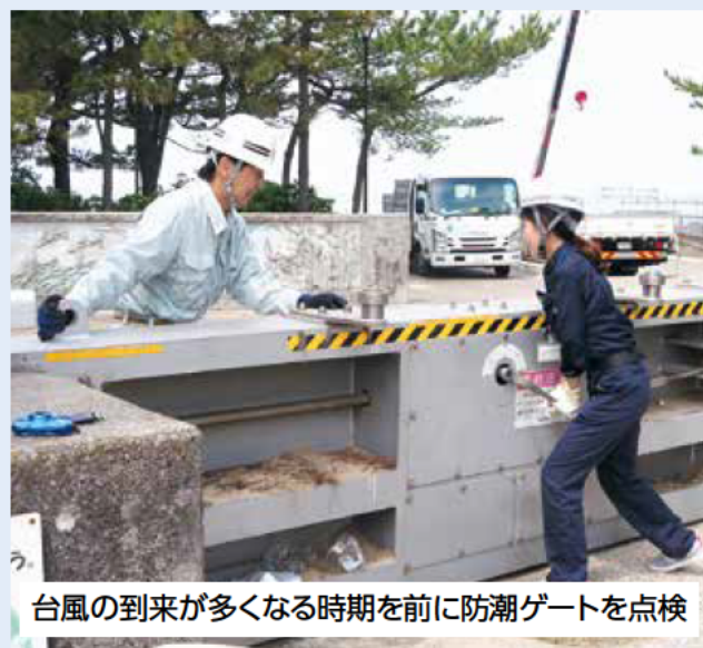
台風の到来が多くなる時期を前に防潮ゲートを点検