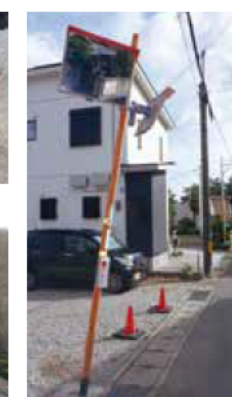
ポストコーンの破損