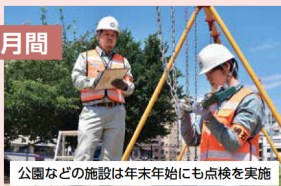
公園などの施設は年末年始にも点検を実施

市が管理するすべての施設を一齐に点検します。不備があった場合は補修などを行い、安心して利用できるように対策をします。