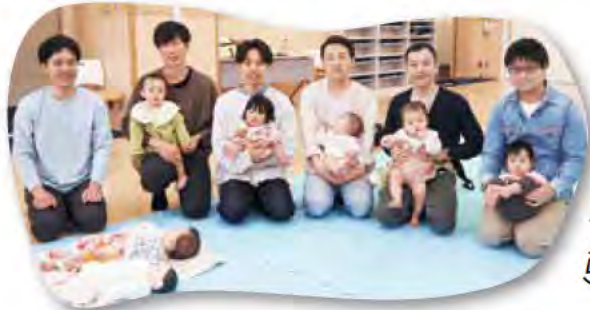
パパ向けのイベントも(4面)