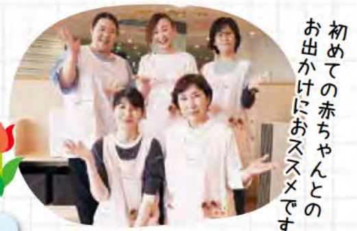
初めての赤ちゃんとのお出かけにおススメです