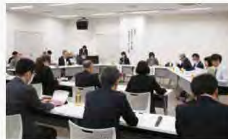
11月1日・あかし保健所

ひきこもり支援体制の整備を図るためネットワーク会議を開催。さまざまな要因や年齢層に応じた支援を行うために関係機関の連携や地域づくりを行っています。