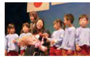
金メダルを手に笑顔で交流

式典では受賞者に表彰状が授与されたほか、パリ2024パラリンピックで、車いすテニス女子2冠に輝き、市長特別表彰を授与された上地結衣選手も登場し、会場は大きな拍手に包まれました。