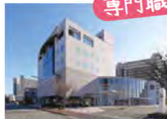
あかし保健所の3階にあります