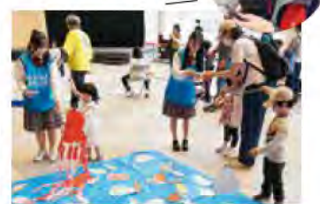
環境フェア2024秋 釣り堀あそび

また、ウィーク期間にあわせて市内の海岸でビーチクリーンを実施し、みんなで明石の海をキレイに掃除しました。