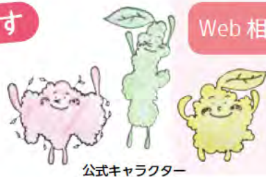
公式キャラクター