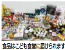
食品はこども食堂に届けられます

家庭の食べきれない食品を持ち寄りください。集まった食品は、市内のこども食堂で活用させていただきます。