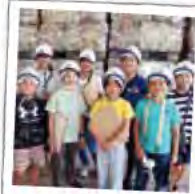
あかしこども新聞