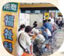
地域でボランティア活動