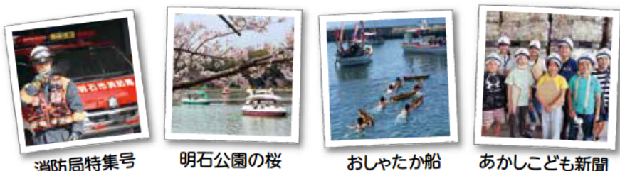
消防局特集号 明石公園の桜 おしゃたか船 あかしこども新聞

明石のイベントや、季節の写真を投稿しています。#ええとご明石のハッシュタグをつけてみなさんも明石の写真を投稿してくださいね。