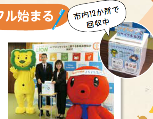
市内12か所で回収中

使用済みのハブラシを回収し、プラスチック再生品にリサイクルする取り組みがスタート。ライオン株式会社と連携してプラスチック資源の再資源化を進めていきます。