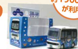
20周年を記念して販売された走るTacoバス型目覚まし時計

2004年11月9日に試験運行を開始したTacoバス。地域の足として親しまれ運行20周年を迎えました。