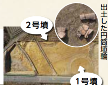
出土した田高埴輪

これまで市内では存在が確認されていなかった5世紀後半の古墳が発掘され、三番割古墳群と名付けられました。