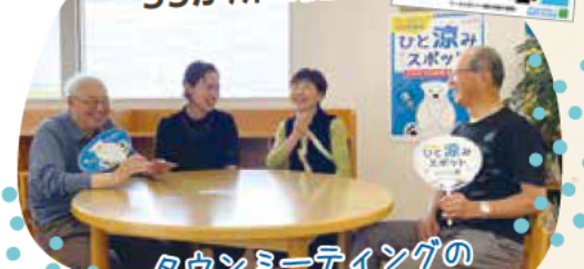
タウンミーティングの声を受け実現