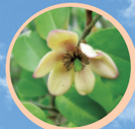
カラタネオガタマ (5~6月)