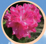
西洋シャクナゲ (4月)