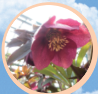
クリスマスローズ (2~3月)