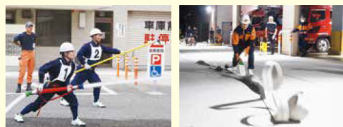
▲ 8月27日に開催する消防操法大会に向けた訓練

災害対応のための訓練を行っています。ほかにも、地域で開催される祭りやイベントでの警戒活動、野焼きの警戒なども行っています。