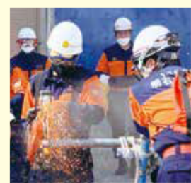
救助資機材取扱訓練の様子