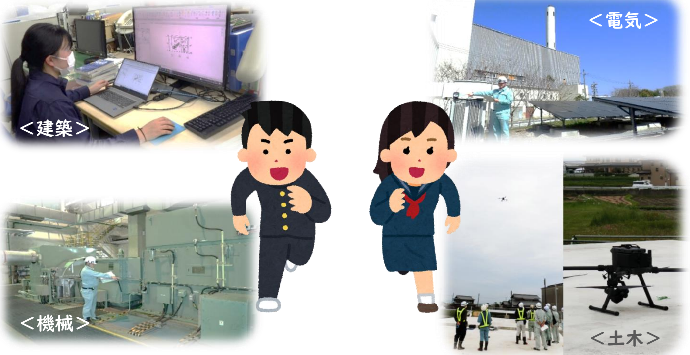
★ 写真は昨年度の業務のワンシーン