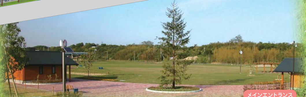
メインエントランス