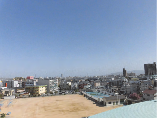
鳥羽小学校屋上より(鳥羽地区方面)